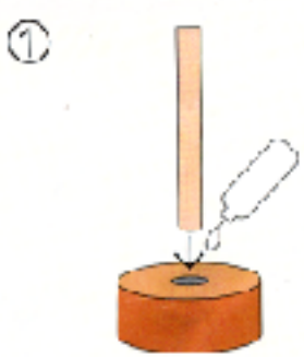
① ツリー台に丸棒にボンドをつけて差し込む。