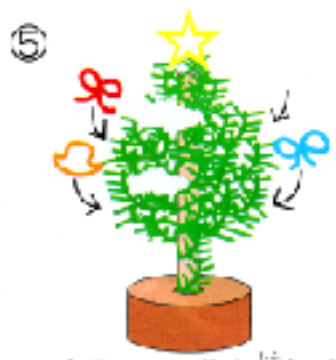
⑤ カラーモールと綿などで飾りつけをする。