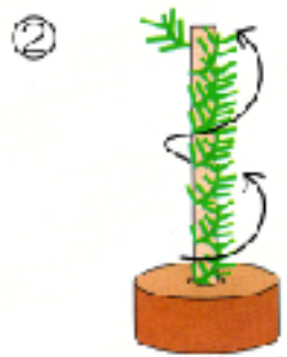
② 下から上に向かってもみの木モールを丸棒が見えないくらいしっかりと巻つける。