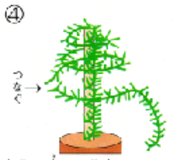
④ もみの木モールを途中でつなげツリーの形を完成させる。